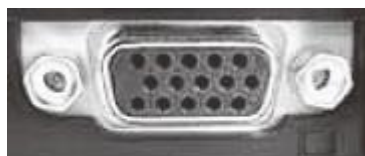
※Mini D-sub15 ピン

一部のノート PC（特に Macintosh）では本体付属のコネクタが必要な場合がありますので，必ずご用意ください。